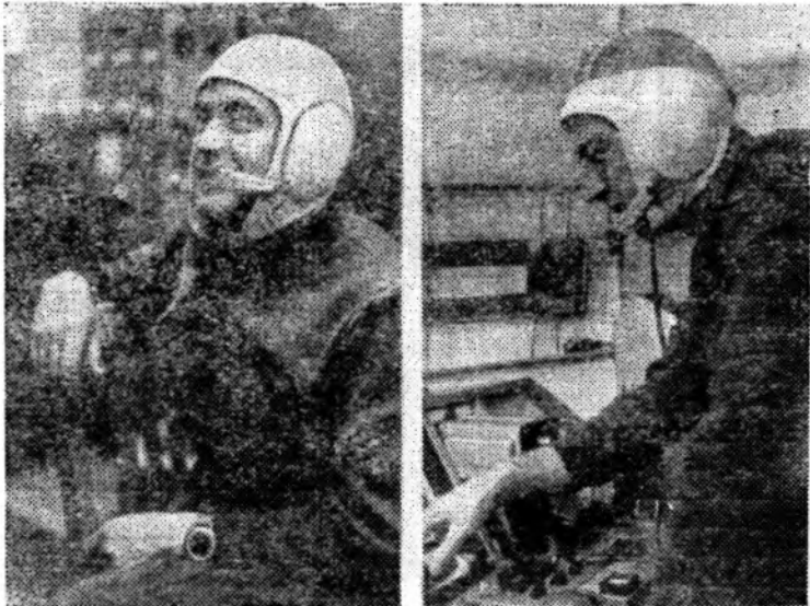
Командир космического корабля «Союз-9» А. Г. Николаев (слева) и бортинженер космического корабля В. И. Севастьянов.