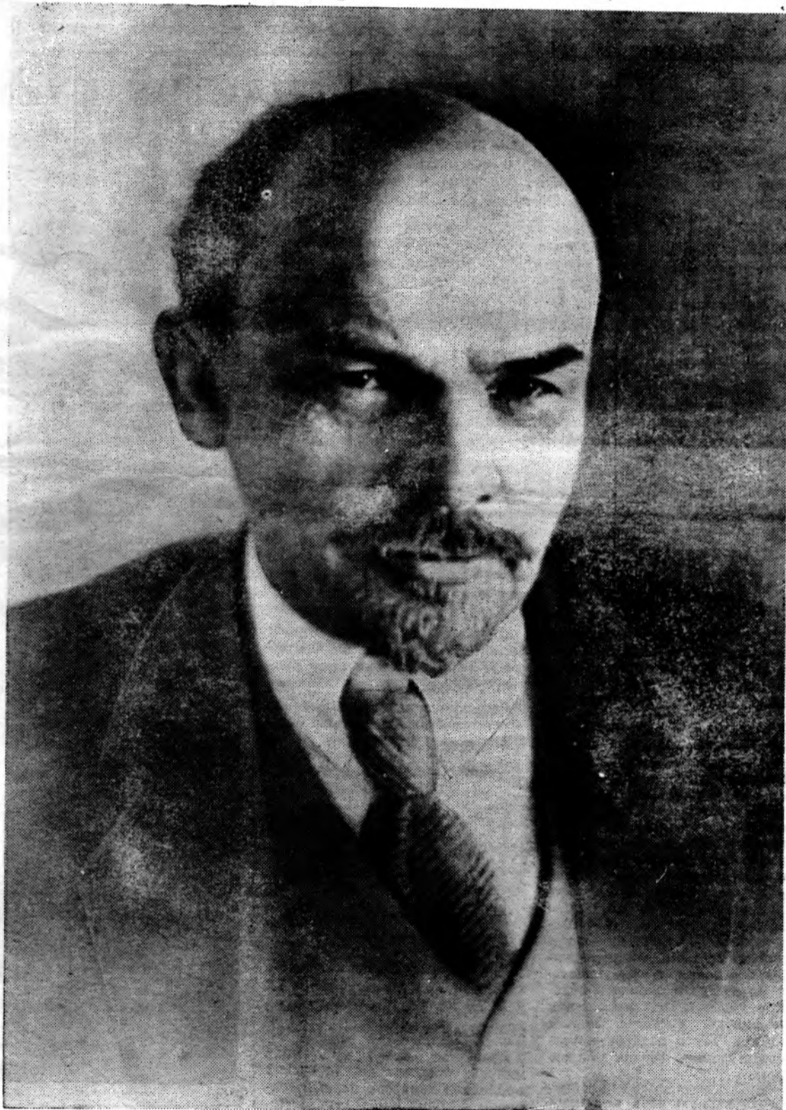
В. И. Ленин. Петроград, январь 1918 года.