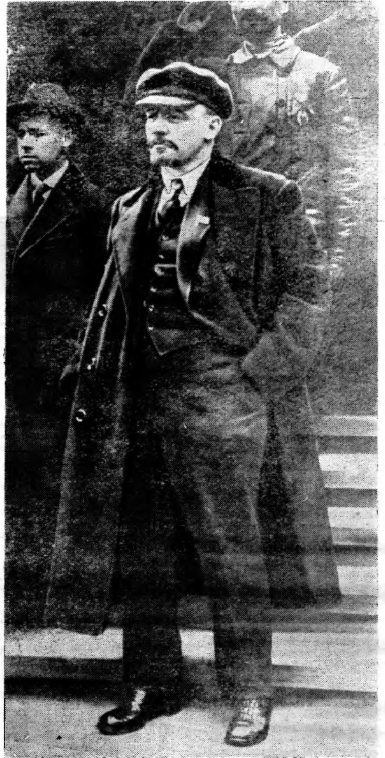
В. И. Ленин на Красной площади во время демонстрации 1 мая 1919 года

● В КОЛХОЗЕ «Ключ Ильича» пенсии получают 146 ветеранов колхоза.