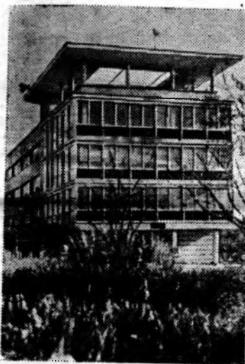
Кавказский курорт Ессентуки, всемирно известный своими минеральными источниками, непрерывно развивается. За последние 15 лет его ежегодная пропускная способность удвоилась.