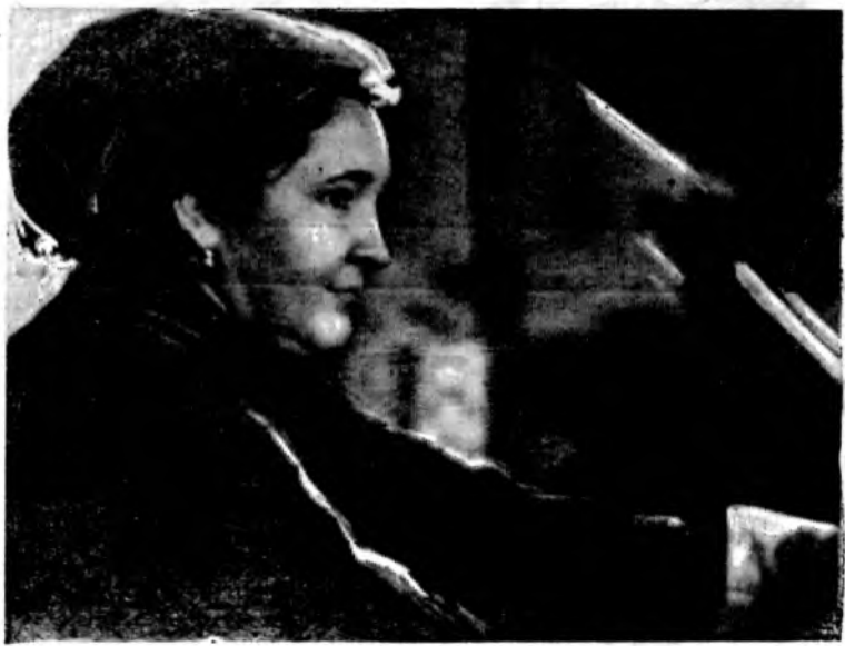
Сегодня на лесоперевалочном комбинате