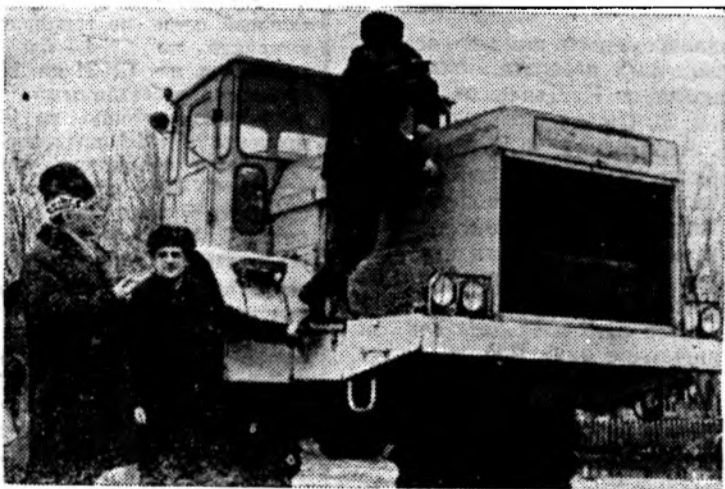
Ростовская область. На Северо-Кавказской машиностроительной станции в Зернограде проходит испытание новой степной богатырь-трактор К-701, созданный на Кировском заводе в Ленинграде.