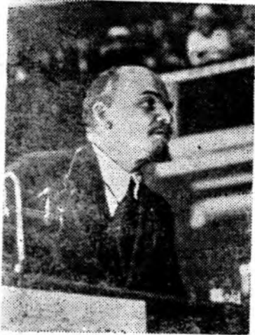
НА СНИМКАХ внизу (слева направо): В. И. Ленин и М. И. Калинин в Доме Союзов во время работы I Всероссийского съезда трудовых казаков. Москва, 1 марта 1920 года.