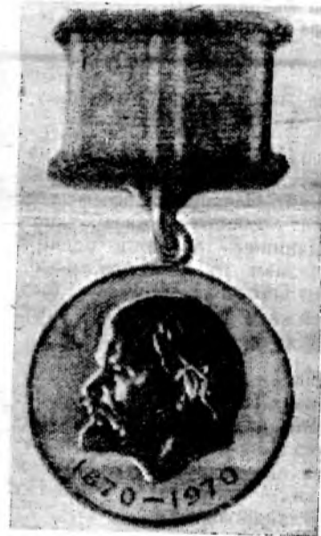
Юбилейной медалью «За доблестный труд (за воинскую доблесть) в ознаменование 100-летия со дня рождения Владимира Ильича Ленина» награждаются:

передовые рабочие, колхозники, специалисты народного хозяйства, работники государственных учреждений и общественных организаций, деятели науки и культуры, показавшие высокие образцы труда в ходе подготовки к ленинскому юбилею;