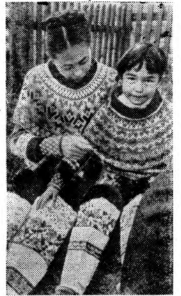
Гренландцы в национальных костюмах.