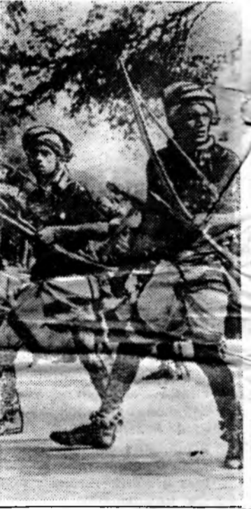
Танец охотников (Индия).