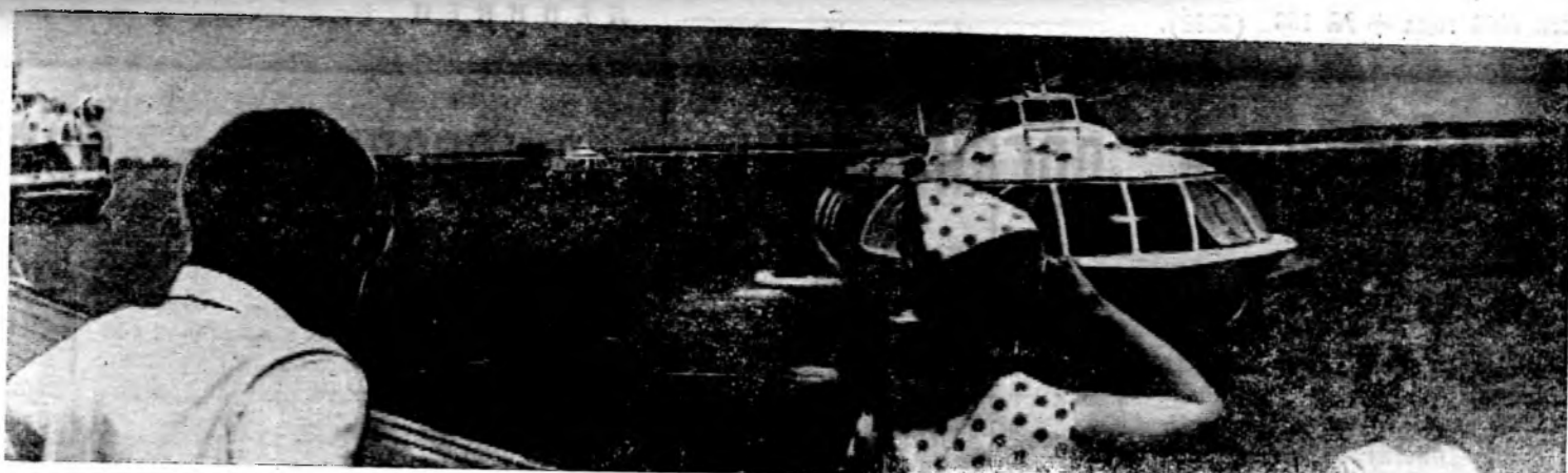
Голубые дороги Фотоэтиюд А. Бурдюгова.