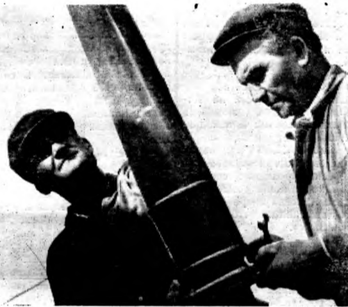
Наряду с другими работами, связанными с подготовкой к зиме, в колхозе «Ключ Ильича» на центральной усадьбе решили хорошо отремонтировать всю водопроводную систему. Вместо старых износившихся водопроводных колонок здесь будут установлены новые.