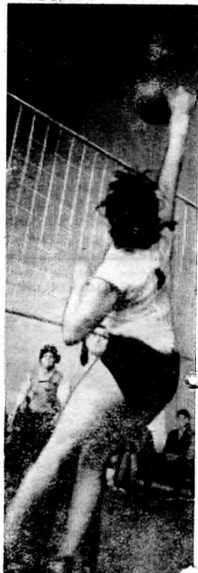
Из всех видов спорта волгодонцы особенно любят волейбол. Нет такого предприятия или учреждения, где бы не было волейбольной команды.

Только в этом году в различных соревнованиях участвовало более 15 команд. Семь из них — женские. Наша сборная мужская команда заняла призовое место во второй группе.