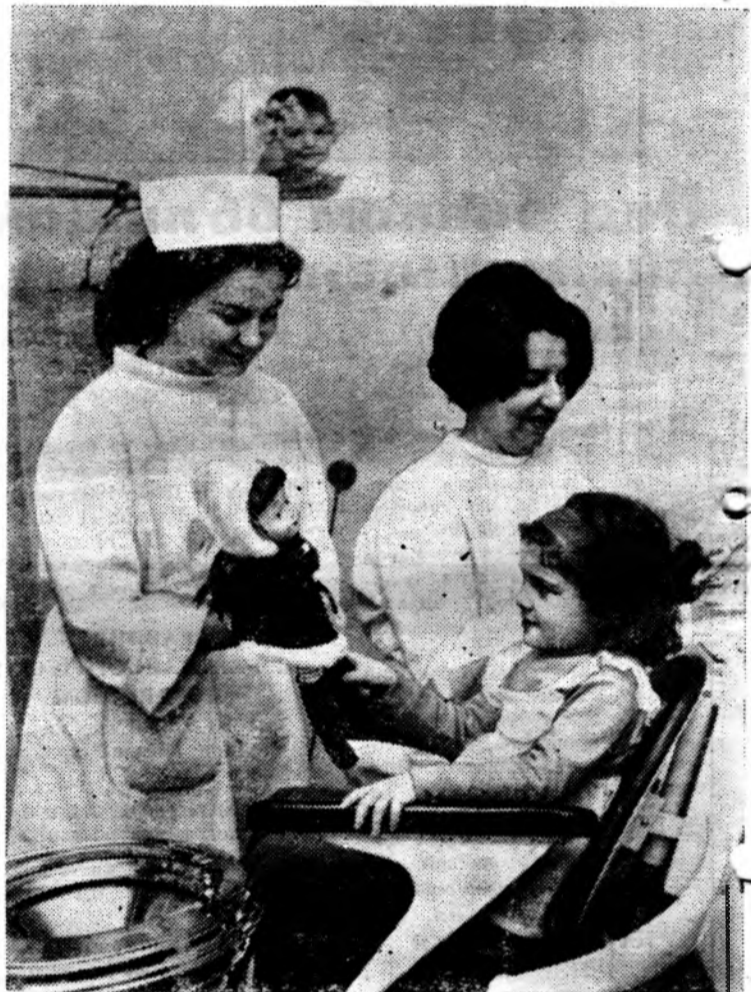
Десятки тысяч людей в белых халатах заботятся о здоровье детей в Народной Польше.