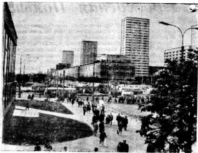
НА СНИМКЕ: Варшава. Центральная магистраль возрожденной столицы — Маршалковская улица.