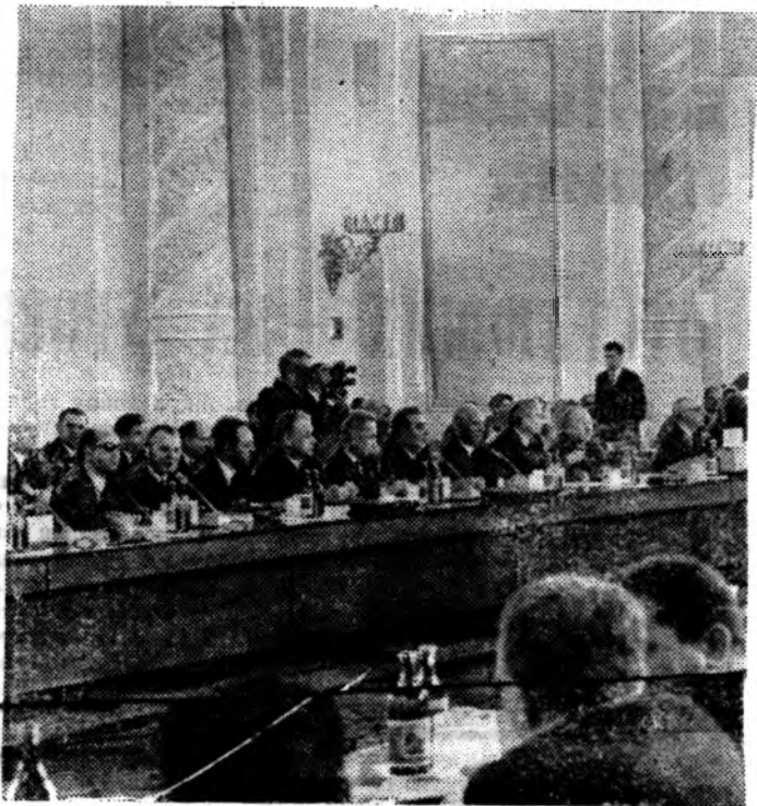
Москва. Международное Совещание коммунистических и рабочих партий. На снимке: в зале заседаний.