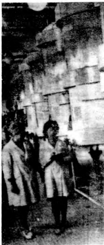
В цехе шампанизации.