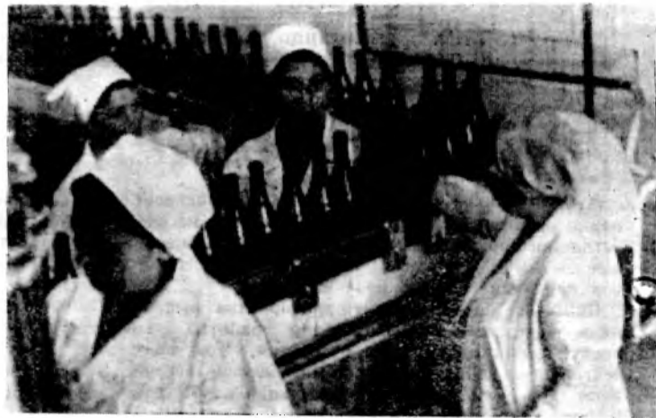
На линии розлива игристого в бутылки.