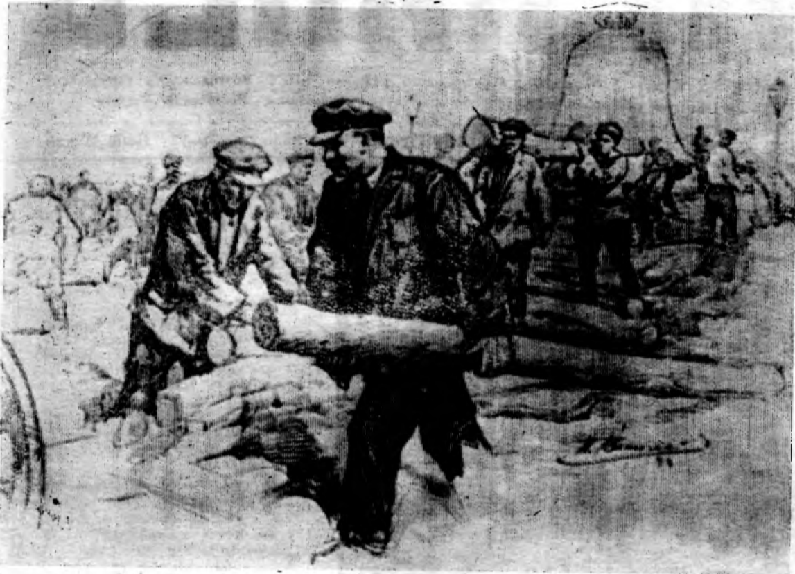
В. И. Ленин на Всероссийском субботнике в Кремле 1 мая 1920 г.