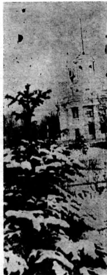
ВОЛГОДОНСК ЗИМНИЙ.