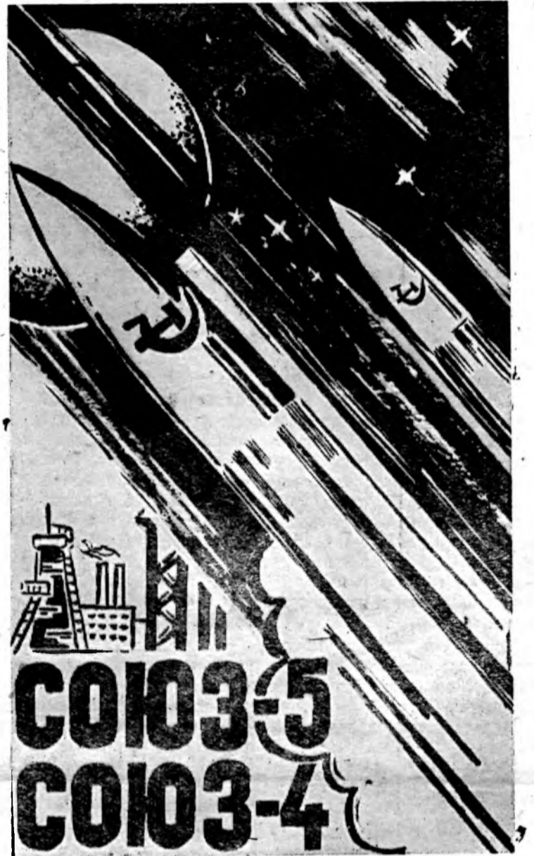
Рисунок А. Бурдюгова.