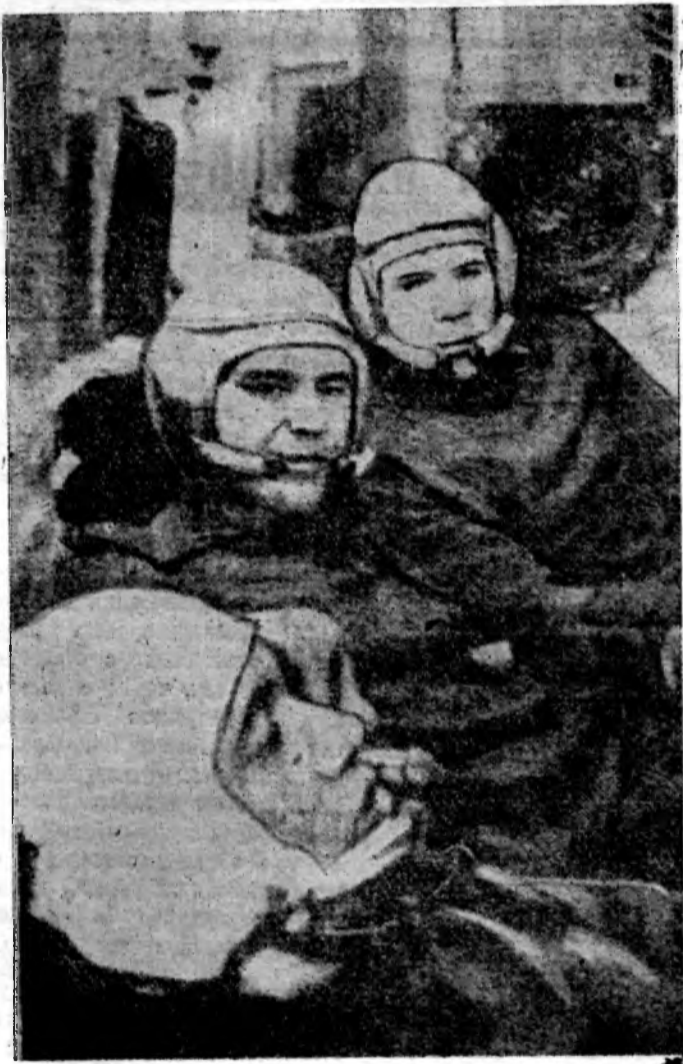
Трое в одной кабине. Командир корабля Владимир Шаталов, Евгений Хрунов и Алексей Елисеев. Последние дни подготовки на земле к космическому полету.

Космический корабль «Союз-5» продолжает полет. Космонавт Б. В. Волюнов выполняет операции, предусмотренные полетным заданием. Самочувствие его отличное. Системы корабля работают нормально.