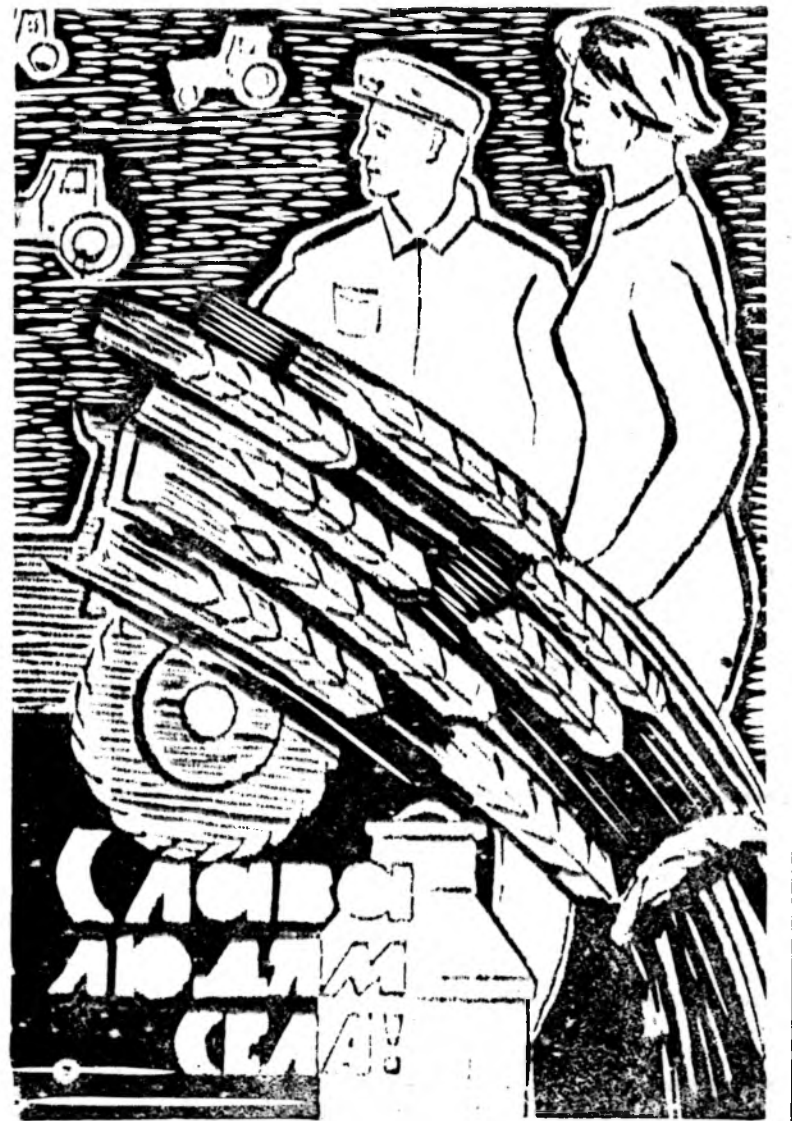
Линогравюра А. Бурдюгова.

● ВАЛОВОЙ доход колхозов в прошлом году составил свыше 21 миллиарда рублей, или на 5 процентов больше, чем в 1966 году.