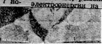
Р. Г. ЕГОРОВА, главный зоотехник.

Идя по пути хозяйского отношения к земле, мы можем с уверенностью заявить, что трудящиеся нашего совхоза досрочно выкосят пятилетку.