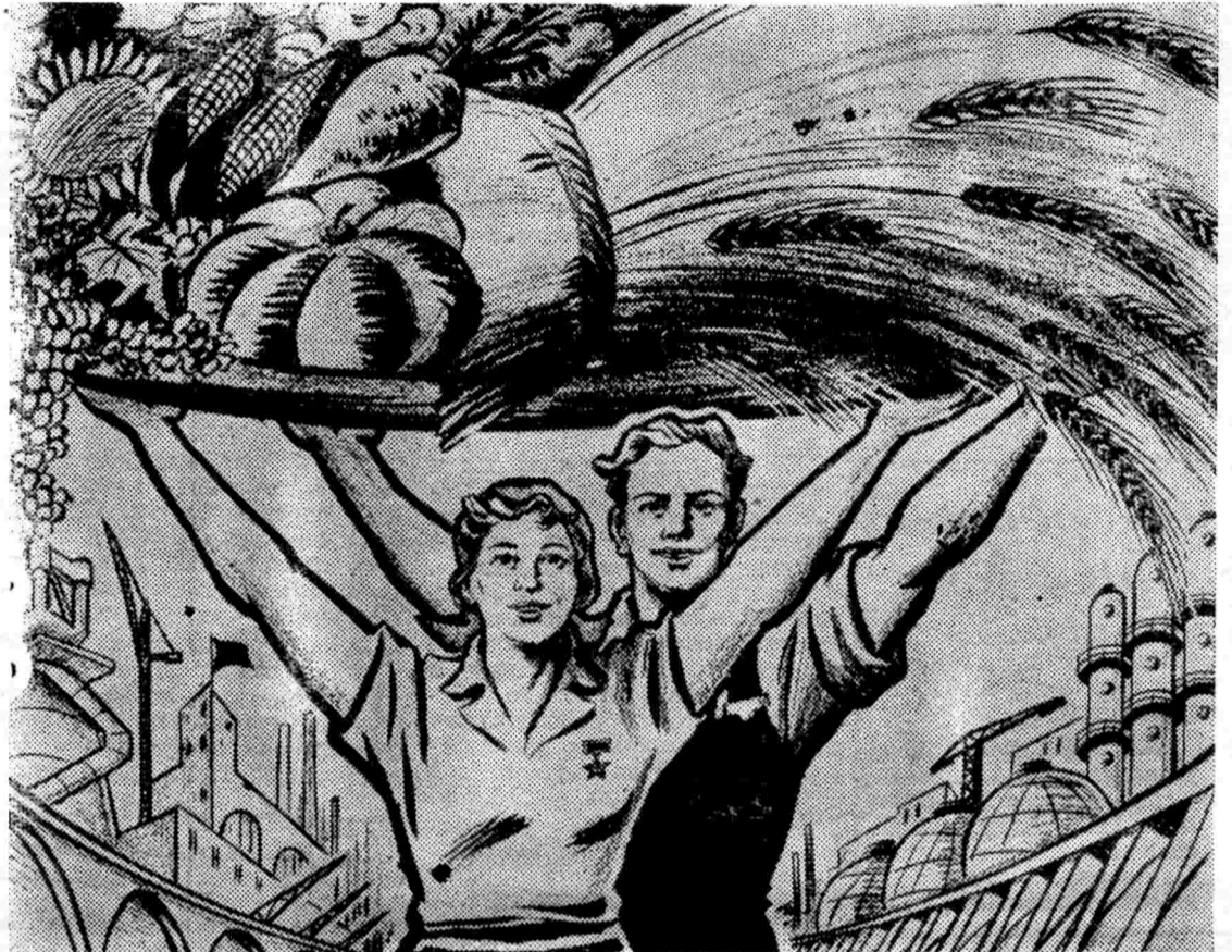
Плакат Ю. Иванова.

С праздником вас, дорогие товарищи труженики сельского хозяйства!