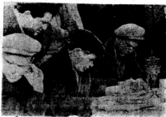
Репортаж о том, кто стал лучшим механизатором района

★ РОВНОЙ шеренгой выстроились стальные кони-тракторы. Их водители будут оспаривать сегодня первенство в соревновании (в центре).