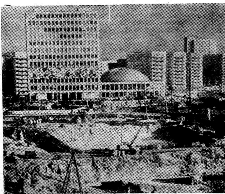
7 октября трудящиеся ГДР торжественно отмечают годовщину образования своей республики — первого в немецкой истории государства рабочих и крестьян. Позади 18 лет успешного строительства основ социализма и борьбы за обеспечение мира. За это время ГДР создала свою мощную энергетику, химическое и сельскохозяйственное машиностроение, судостроение, автомобильную промышленность и другие отрасли современной индустрии.

Можно продолжить перечисление подобных фактов. Но не лучше ли посоветовать всем тем, от кого зависит быстрое и правильное рассмотрение жалоб трудящихся, прочитать еще раз постановление ЦК КПСС «Об улучшении работы по рассмотрению писем и организации приема трудящихся». Кстати, там говорится и о том, что партийным, советским и профсоюзным органам, руководителям предприятий, учреждений и организаций поручено своевременно принимать меры по выступлениям печати и сообщать об этом в редакции газет и журналов.