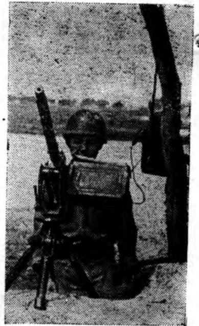
● ПОГРАНИЧНИК независимой Камбоджи на страже рубежей родины.