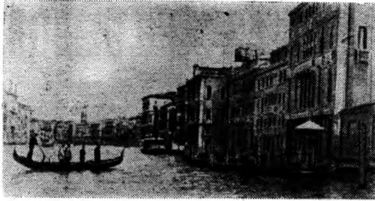
● ИТАЛИЯ. Гондола на Большом канале в Венеции.