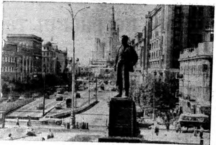
МОСКВА. Площадь Маяковского.