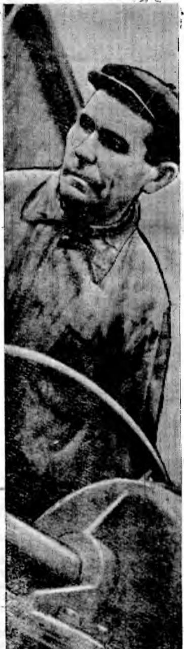
Участок сборки грейдеров на Волгодонском заводе по ремонту дорожных машин долгое время удерживает первенство в социалистическом соревновании сборочного цеха.