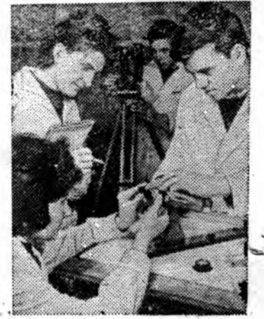
СОФИЯ. Учащиеся техникума оптической механики на занятиях. Сейчас в Болгарии учится каждый пятый человек. Образование стало подлинным достоянием народа.