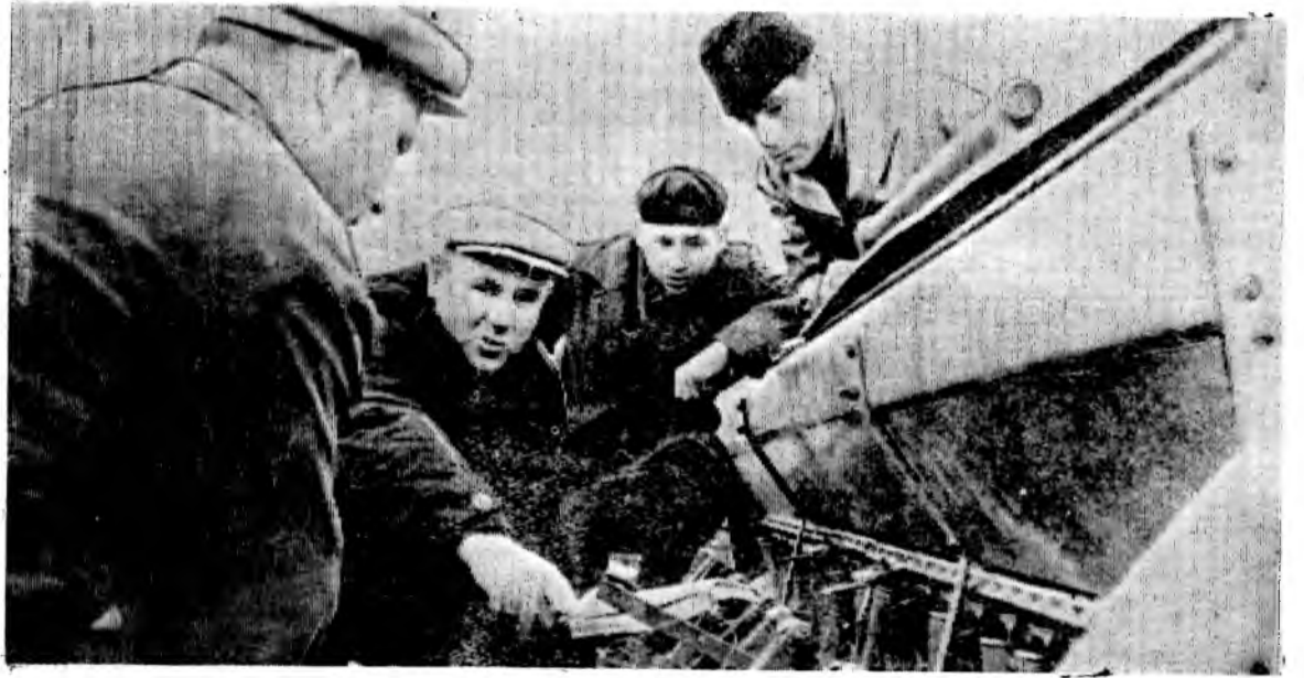
В овощеводческом совхозе «Волгодонской» созданы курсы трактористов. 18 курсантов будут четыре месяца изучать устройство и эксплуатацию тракторов и сельхозмашин.