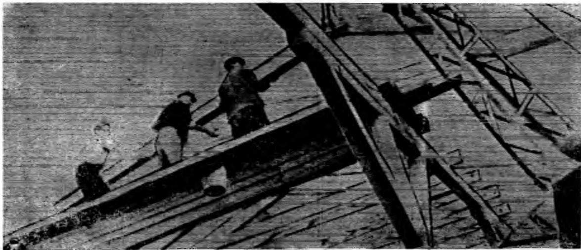
В этом году примет животных новый типовой коровник на 200 голов, сооруженный в колхозе «40 лет Октября». На его строительстве заняты бригады из Цимлянского строительномонтажного управления.