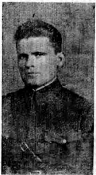
Лид войны не остался без дела. Вернувшись в родную станицу Романовскую, был председателем Осовнахима, затем работал бухгалтером в больнице.

После этого ранения воевать больше не пришлось. Но инва-