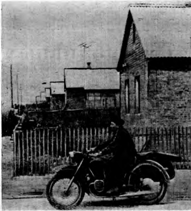
НА СНИМКЕ: станция Камышевская. Новая улица.