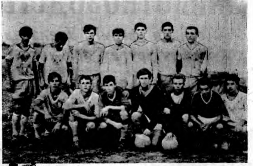
Фото и текст В. Мальцева.

НА СНИМКЕ: команда «Геофизик» — обладатель кубка газеты «Комсомолец» 1966 года.