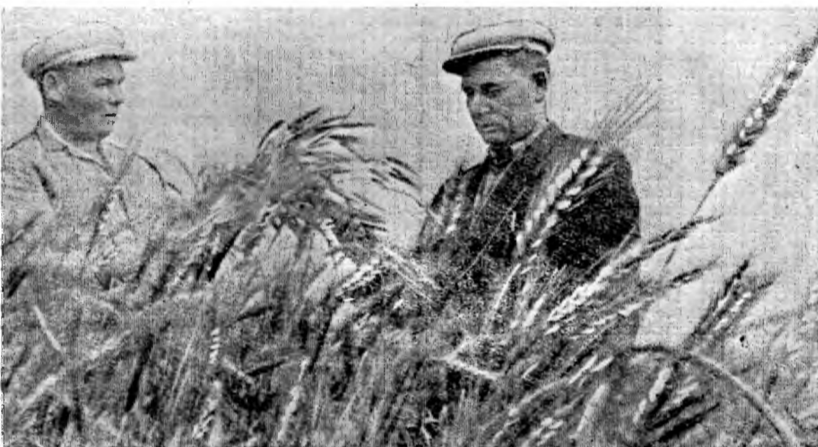
ПРОИДЕТ день, второй, и в зерносовхозе «Добровольский» начнется уборочная страда. А пока управляющий отделением (на снимке

Действительно, погода испортилась неожиданно. Но о том, как быстрее организовать сеноуборку, руководителям и специалистам хозяйства стоило бы подумать заранее. Только неорганизованностью объясняется допущенный большой разрыв