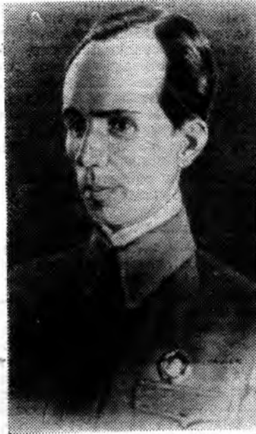
Николай Островский, Фотохроника ТАСС.