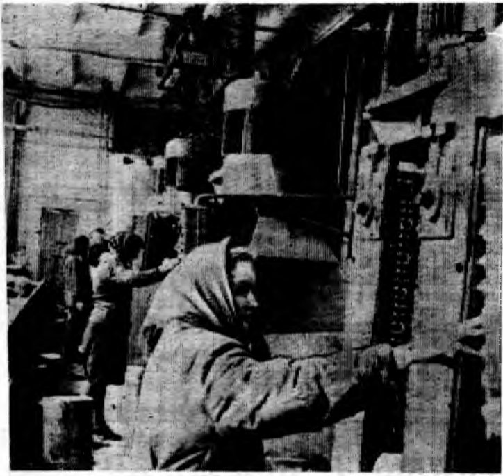
Стружечное отделение цеха древесно-стружечных плит Цимлянкой лесоперерабаточной базы. Здесь трудится дружный, спаянный коллектив.