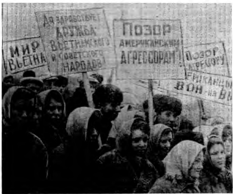
НА СНИМКЕ: митинг протеста против американской военной агрессии во Вьетнаме, который прошел в первом стройуправлении стройтреста № 3.