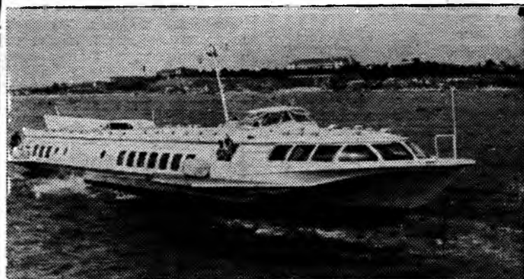
БОЛГАРИЯ. Между черноморскими портами Варна и Бургас курсирует быстроходное пассажирское судно на подводных крыльях «Комета», доставленное из Советского Союза.

НА СНИМКЕ: «Комета» близ Несебры.