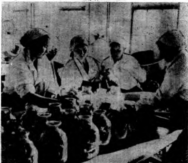
Фото и текст А. Бурдюгова.

Есть основания надеяться, что мартыновские пищевики выполнят поставленные перед ними задачи.