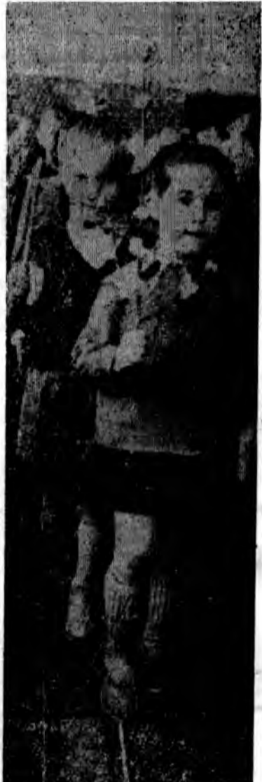
Весело и интересно проводят время воспитанники детского сада Цимлянской лесоперевалячной базы.