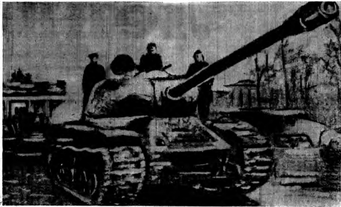
Май 1945 года. Советские танки в Берлине.