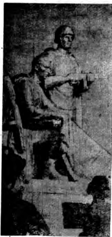
НА СНИМКЕ: памятник павшим воинам в хуторе Потапове.