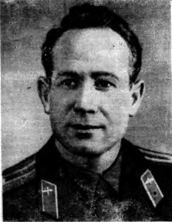
Командир космического корабля-спутника «Восход-2» летчик-космонавт полковник Павел Иванович Беляев (слева) и второй пилот корабля летчик-космонавт подполковник Алексей Архипович Леонов.