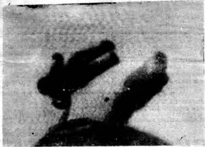
Первый выход человека из корабля в космическое пространство. Внизу — корпус корабля-спутника «Восход-2». Слева — второй пилот летчик-космонавт подполковник А. А. Леонов в специальном скафандре. Снимок сделан с экрана телевизора.