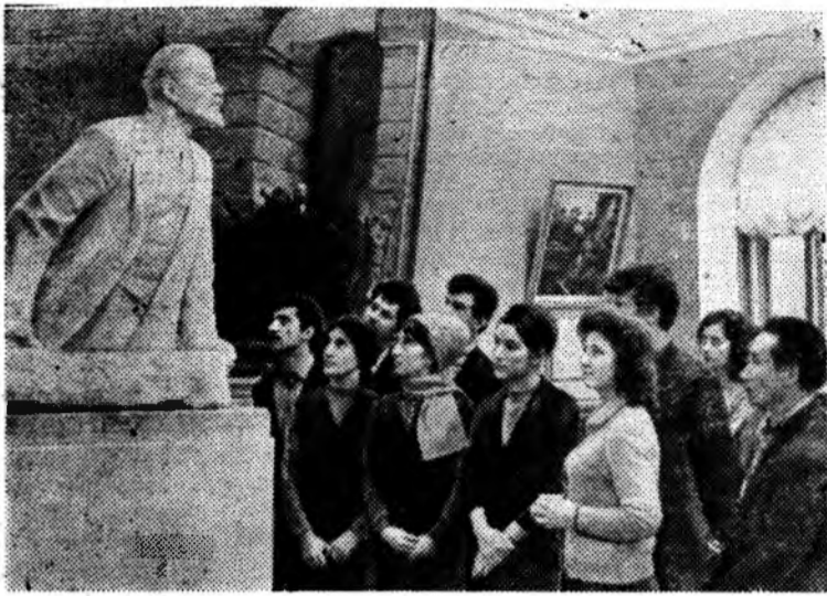
МОСКВА. В залах Центрального музея В. И. Ленина всегда оживленно. Здесь можно встретить и коренных москвичей и гостей из разных районов Советского Союза и многих стран мира. Они приходят сюда, чтобы ознакомиться с материалами, рассказывающими о жизни и деятельности великого вождя, создателя и руководителя первого в мире государства рабочих и крестьян В. И. Ленина.