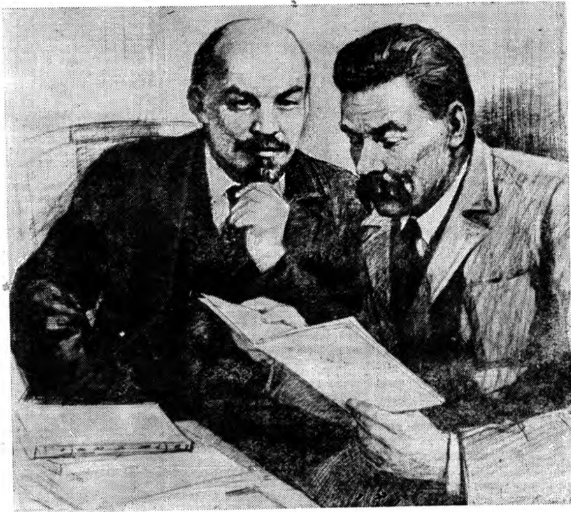
В. И. Ленин и А. М. Горький. Рисунок заслуженного деятеля искусств РСФСР П. Васильева, Фотохроника ТАСС.