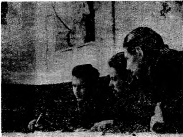
Агитпункт поселка Шлюзы ведет большую работу среди избирателей.