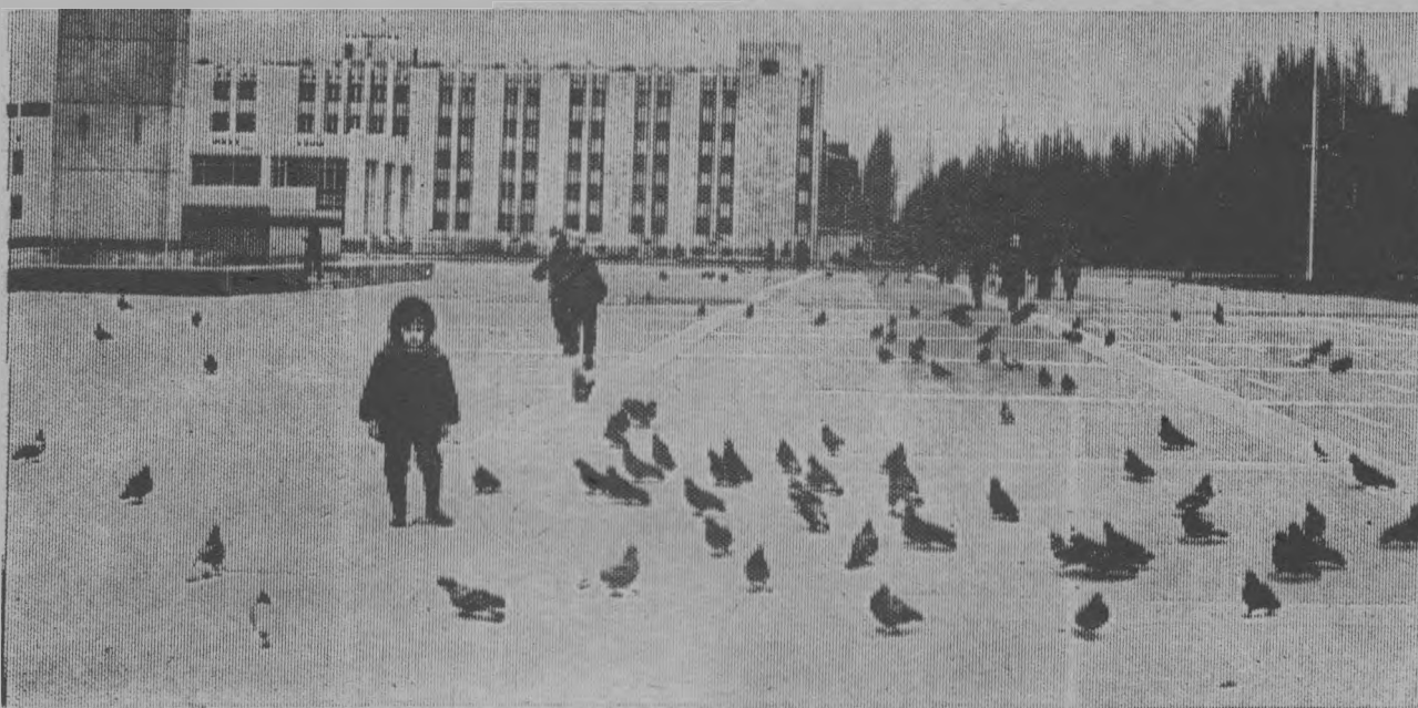
На площади Победы. Осень.