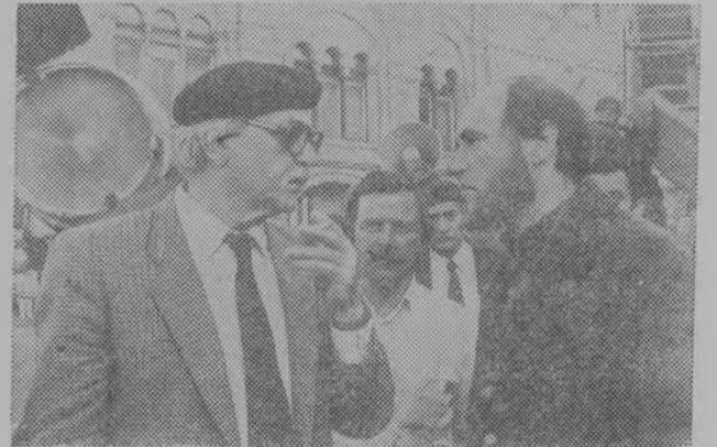
Москва. На киностудии «Мосфильм» идут съемки двухсерийного цветного фильма «Борис Годунов» — экранизация бессмертной трагедии А. С. Пушкина.

Съемочную группу возглавляет народный артист СССР, лауреат Ленинской и Государственной премии СССР, Герой Социалистического Труда Сергей Бондарчук. Главный оператор фильма — лауреат Ленинской и Государственной премии В. И. Юсов. На снимке: на съемках фильма в Москве. Сцену репетирует С. Бондарчук.