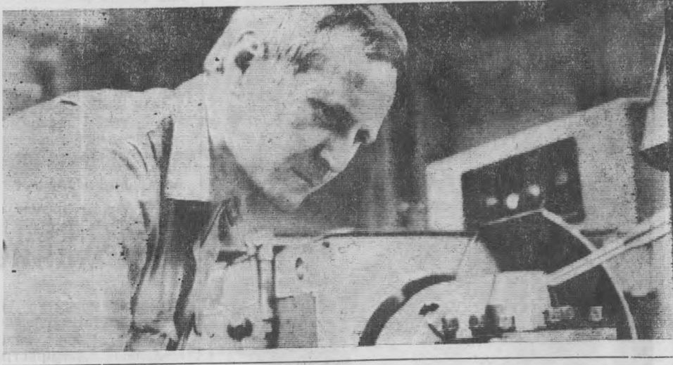
Возвращаясь к напечатанному