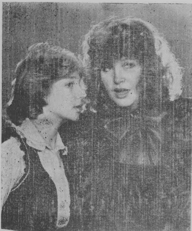
Москва. На центральном телевидении идут съемки традиционного «Голубого огонька», посвященного