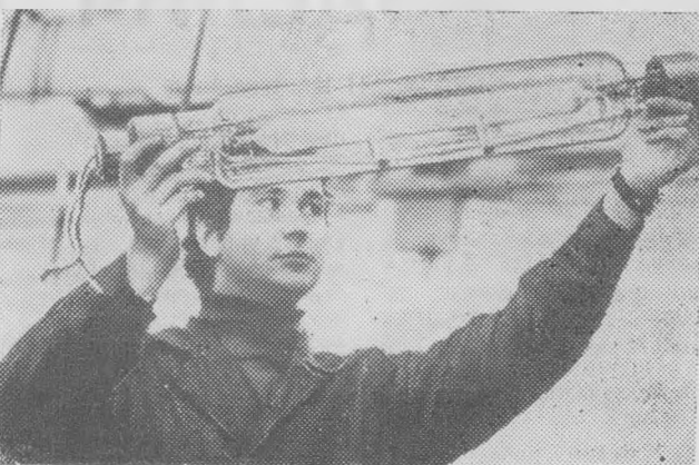
Москва. И в условиях покусственного солнца — трехфазных металлогалогенных ламп, световой спектр кото-

рых близок солнечному. Одной лампы мощностью в шесть тысяч ватт достаточно для освещения 40-60 квадратных метров теплицы. Урожайность растений повышается в 2-3 раза, а расход электроэнергии, по сравнению с широко применяемыми для этих целей другими лампами, сокращается в 3-5 раз.