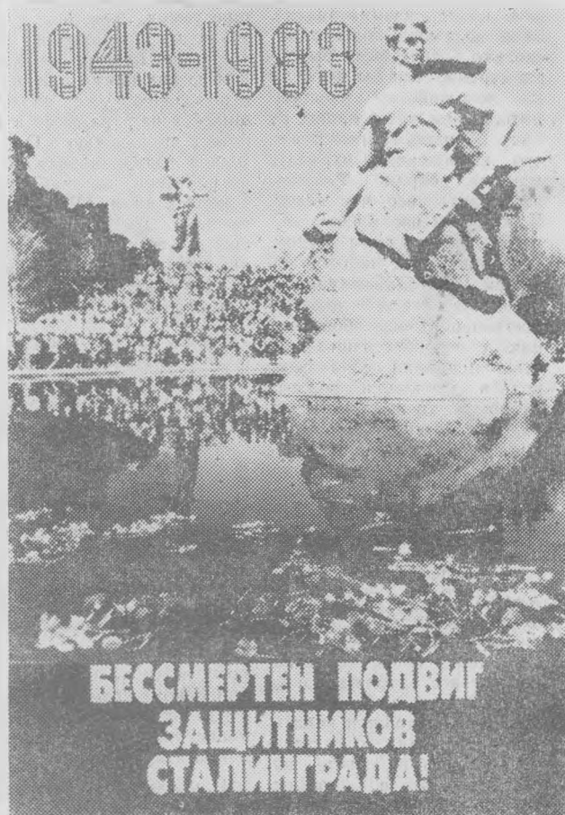
Авторы плаката Д. Воздвиженский и В. Горячев. Издательство «Плакат».

2 ФЕВРАЛЯ 1943 ГОДА БЫЛА ЗАВЕРШЕНА ЛИКВИДАЦИЯ НЕМЕЦКО-ФАШИСТСКИХ ВОЙСК, ОКРУЖЕННЫХ В РАЙОНЕ СТАЛИНГРАДА.